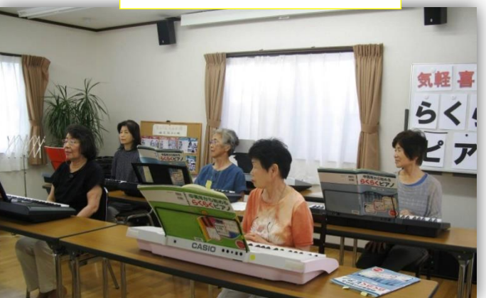
らくらくピアノ教室の演奏