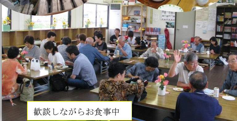
歓談しながらお食事中