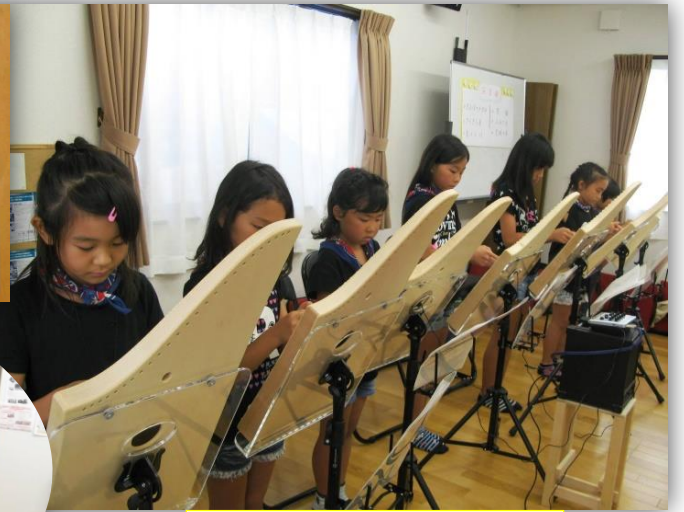
子どもハーブ教室の演奏