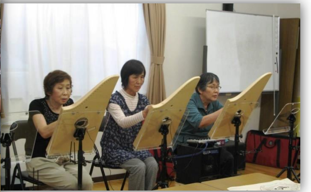
ヘルマンハーブ教室の演奏