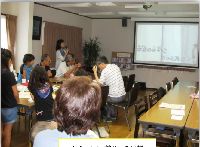
カラオケ道場で発散