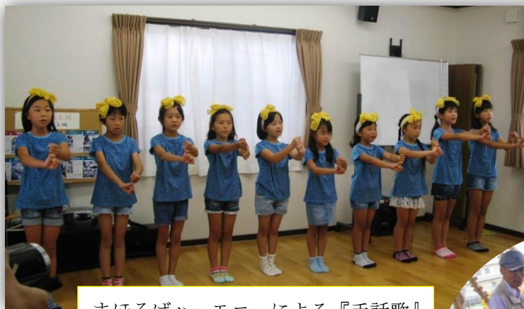
まほろばハーモニーによる『手話歌』

平和な我がまほろばの郷では、今年も6月19日(日)に、日ごろ当施設をご利用頂きお世話になっている皆様に感謝を込めた『まほろばまつり』を執り行いました。今年の祭りは、音楽の祭典とでも申しましょうか、音楽関係の各教室から発表をしていただき、出演者も観客もお互いに楽しんでいただけたと思います。もちろんいつものようにピザやそうめん、カレー、燻製など食事も楽しく食して頂きました。